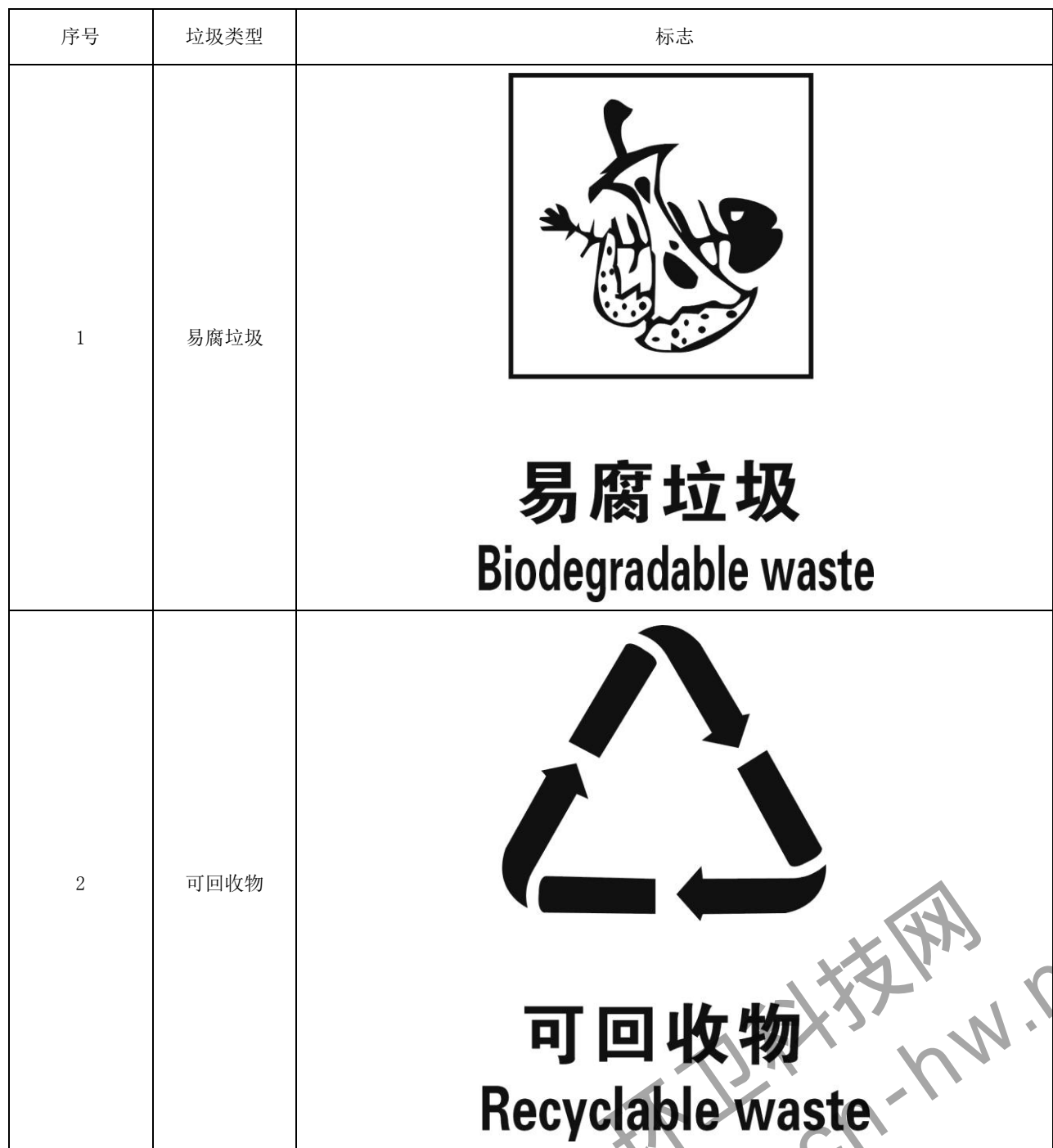
表A.1 农村生活垃圾分类标志

农村生活垃圾分类标志见表A.1，彩色标志的颜色可按照GB/T 19095的要求。